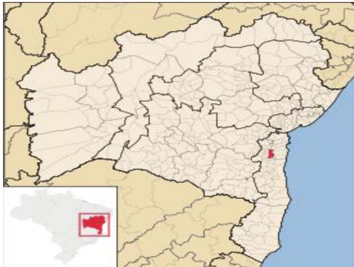
Figura1: Mapa com localização de Ibirapitanga.